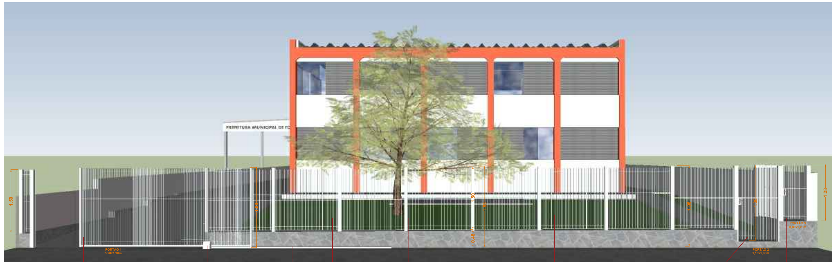
VISTA FRONTAL Sem Escala

PORTÃO 1 5,40x1,98m Vão 5,20m Portão de correr